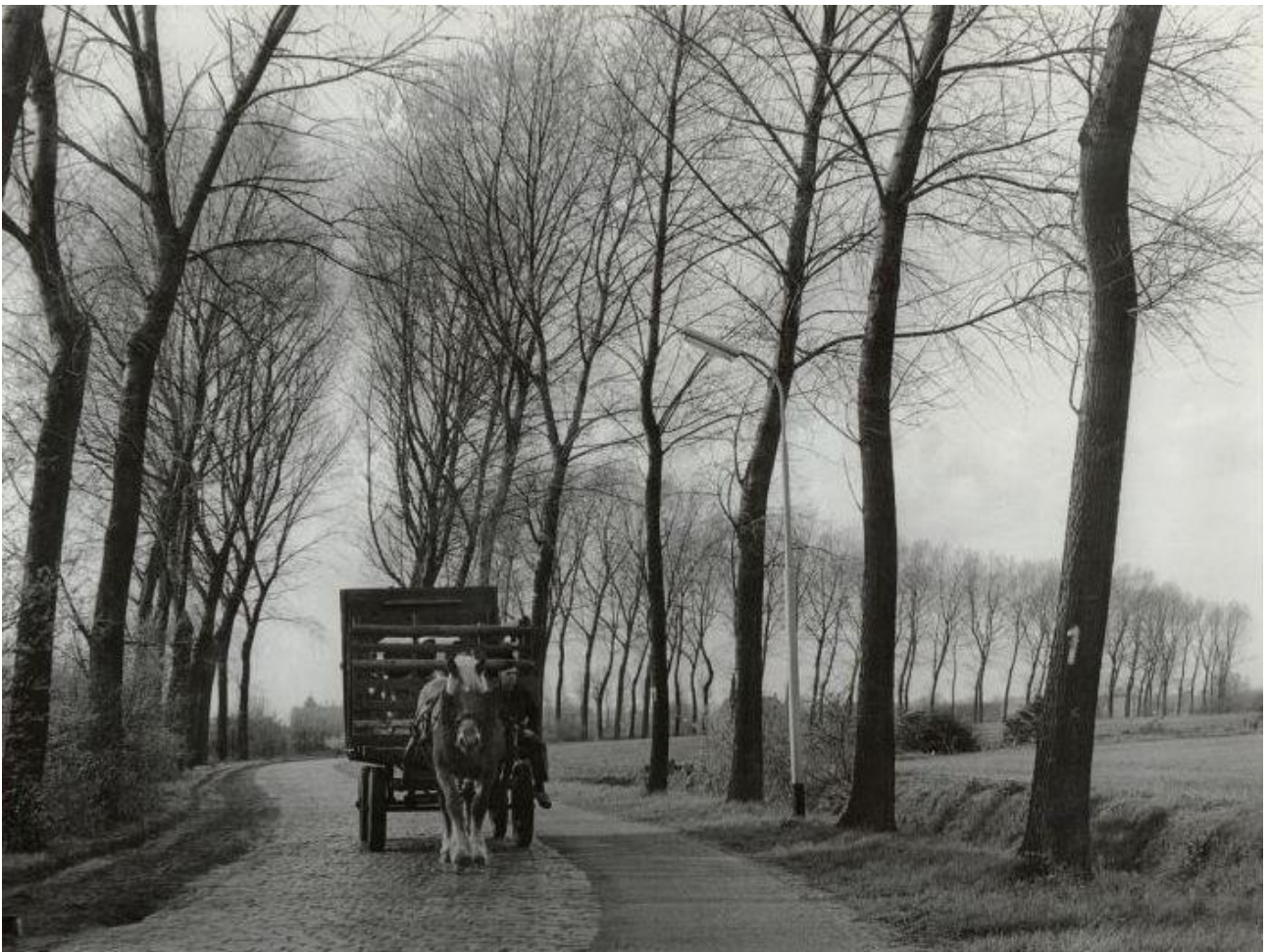
Effenseweg in 1960

Het dorp Effen is een van de meest recent ontstane dorpen in de gemeente Breda. Het dateert pas van vlak vóór de Tweede Wereldoorlog. In Effen was rond 1900 al een tramhalte, waardoor hier toen reeds spontaan enige bebouwing was ontstaan, waaronder een veiling en een café (Halte Effen). De huidige Effenseweg is pas aangelegd in 1929 om Overa beter te ontsluiten vanuit Princenhage. In 1939 werd de kerk gebouwd op de hoek van de Rijsbergseweg en de Effenseweg, met de bedoeling dat zich hier te zijner tijd een dorp zou vormen. Na de Tweede Wereldoorlog ontstond hier inderdaad de huidige bebouwde kom van Effen.