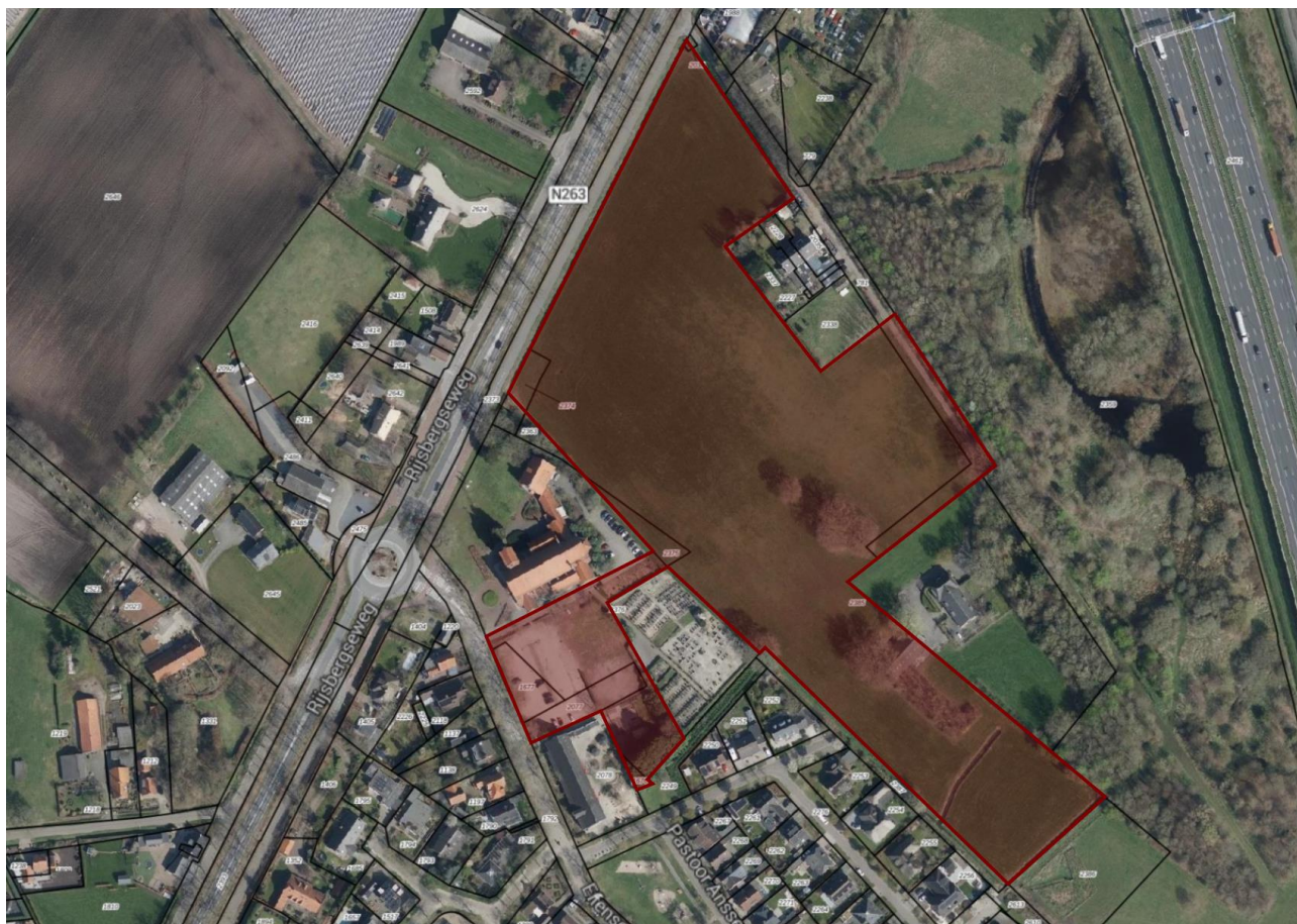
Plangebied in-/uitbreiding Effen

Het plangebied ligt grotendeels buiten de bebouwde kom van Effen en voor een klein deel erbinnen. Onderstaande luchtfoto met omkadering van het beoogde plangebied geeft weer hoe de locatie is gelegen.